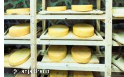
@ Tanja Braun