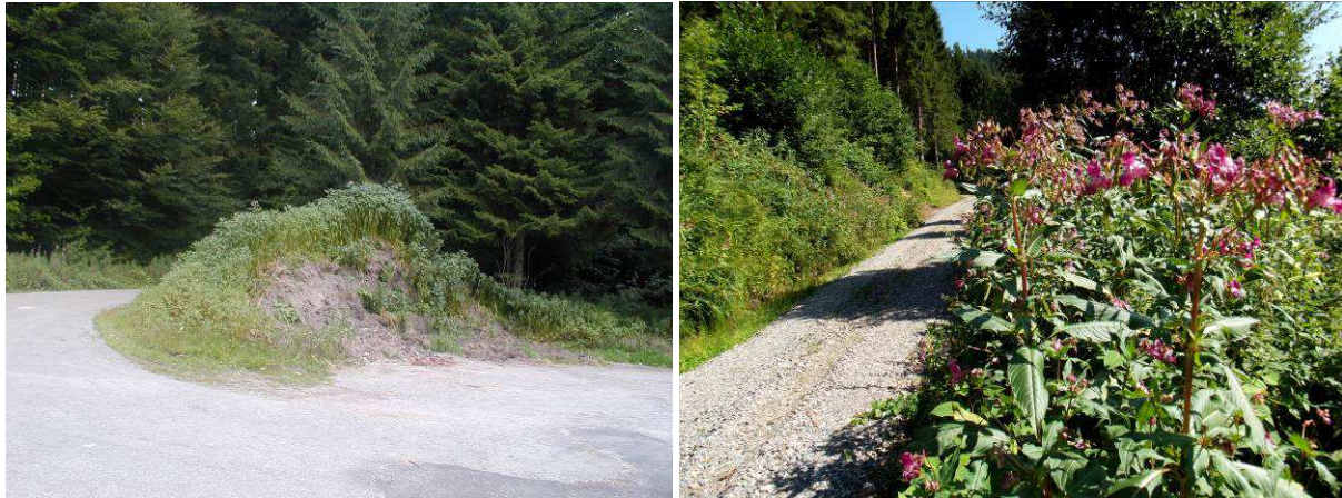
Von einem Zwischenlager mit Erdaushub hat sich das Springkraut entlang der Waldwege bis in die Wiesen ausgebreitet

Umgeknickte Pflanzen treiben an den Knoten Wurzeln und können dann aufrecht weiterwachsen. Die bis zu 2,5 Meter hohen Bestände verdrängen alle anderen Staudenpflanzen, nicht einmal die Brennnessel kommt dagegen an.