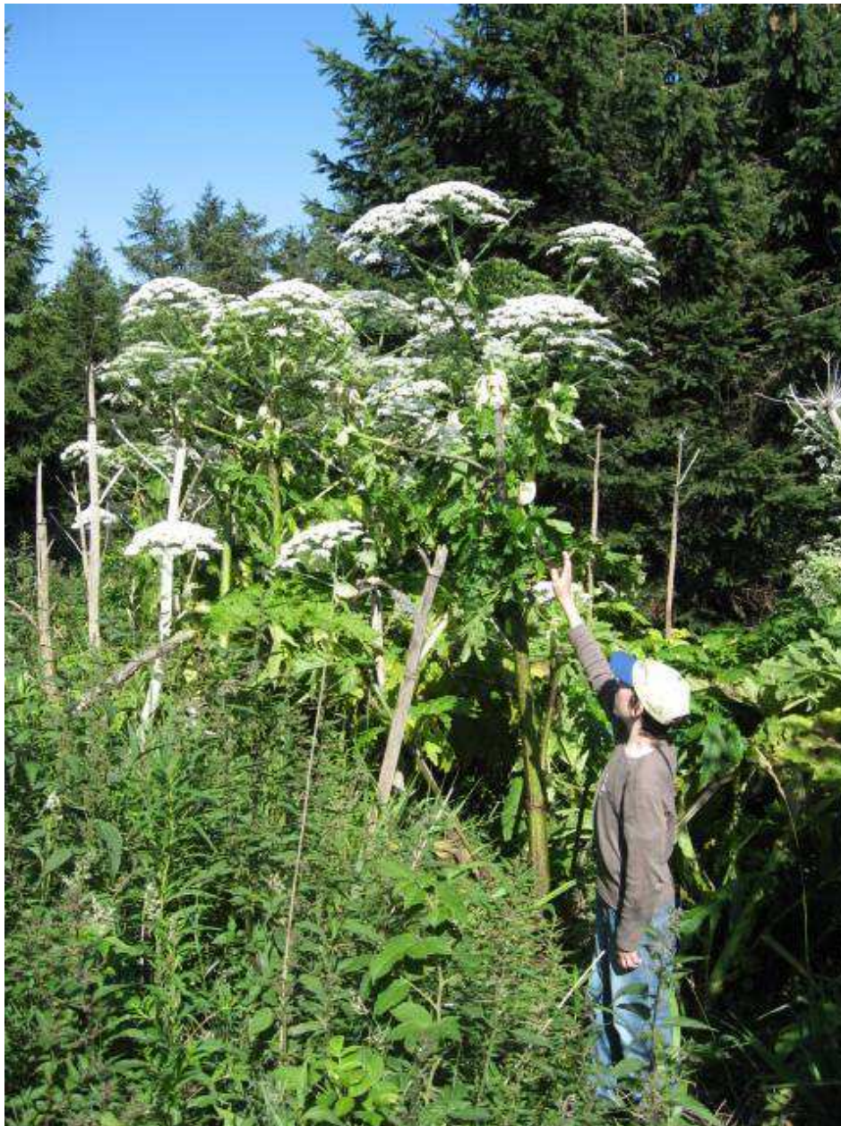
Riesenbärenklau neben der Schwarzwaldhochstraße im Naturschutzgebiet „Schliffkopf“

Amt für Bau, Umwelt und Wasserwirtschaft