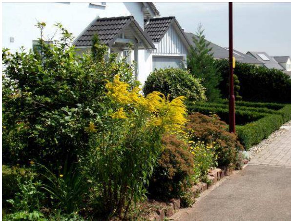
Die Zierpflanze wandert aber allzu leicht aus dem heimischen Garten in die freie Landschaft