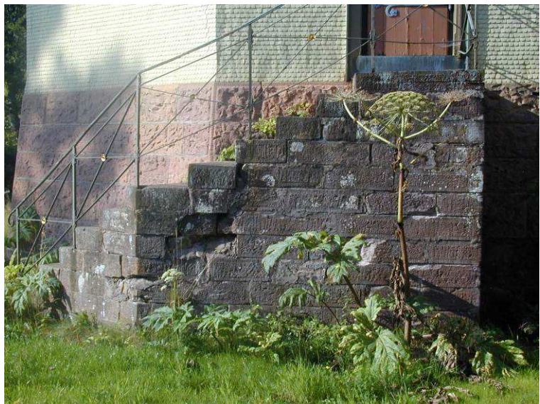
Der Riesenbärenklau findet sich im Landkreis immer häufiger in der Umgebung nicht mehr genutzter Gebäude und Gärten