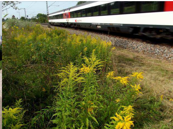
Verbreitung durch die Ablagerung von Gartenabfällen , hier entlang einer Bahnstrecke