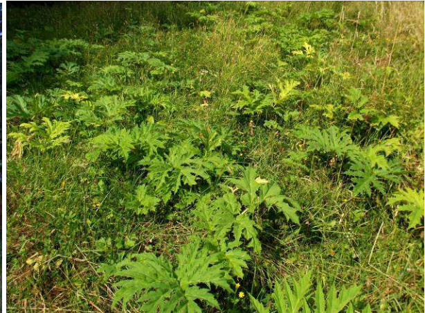
Nachtrieb bei zu früher Mahd – Kontrollen sind notwendig