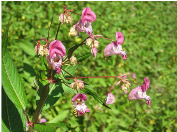
Das Springkraut in voller Blüte ...