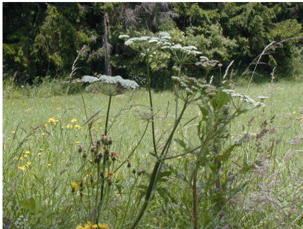
Heimischer Wiesenbärenklau (hier ca. 50 cm hoch)