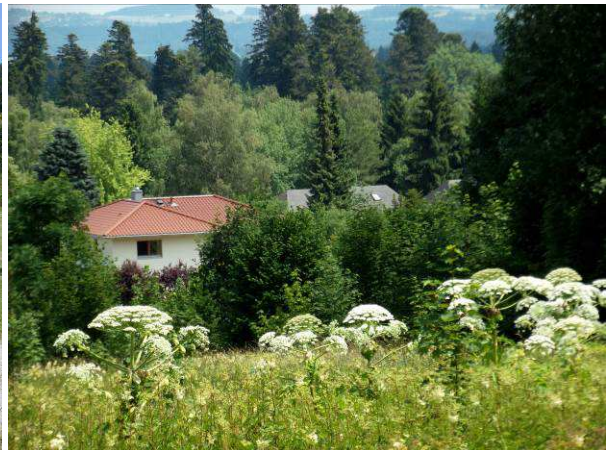
Auf Brachflächen bilden sich auch größere Bestände