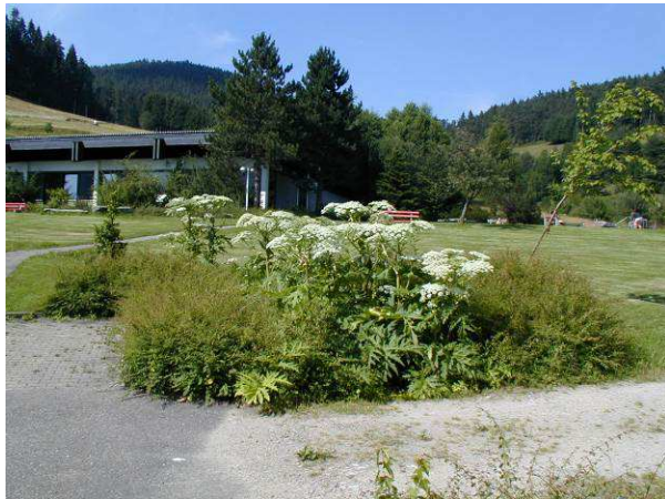
... und als Zierpflanze in öffentlichen Grünanlagen