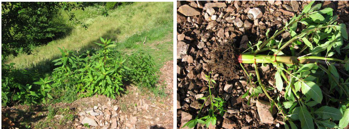
Auch starke Pflanzen können bei Neuansamungen wegen der kleinen Wurzelballen leicht ausgerissen werden

Mit diesen Maßnahmen soll die Verbreitung neuer Samen verhindert werden. Dies kann jedoch nur zum Erfolg führen, wenn von anderen Gebieten keine neuen Samen eingetragen werden, vor allem nicht durch Hochwasser. Mit der Bekämpfung sollte daher möglichst am Oberlauf der Fließgewässer begonnen werden, damit nicht durch den Samentransport flussabwärts ein ganzes Tal mit Springkraut besiedelt wird (diese Regel gilt eigentlich für die Bekämpfung aller Neophyten). In den folgenden Jahren muss kontrolliert und gegebenenfalls nachgearbeitet werden, da sich neue Bestände aus den Samenvorräten im Boden entwickeln können.