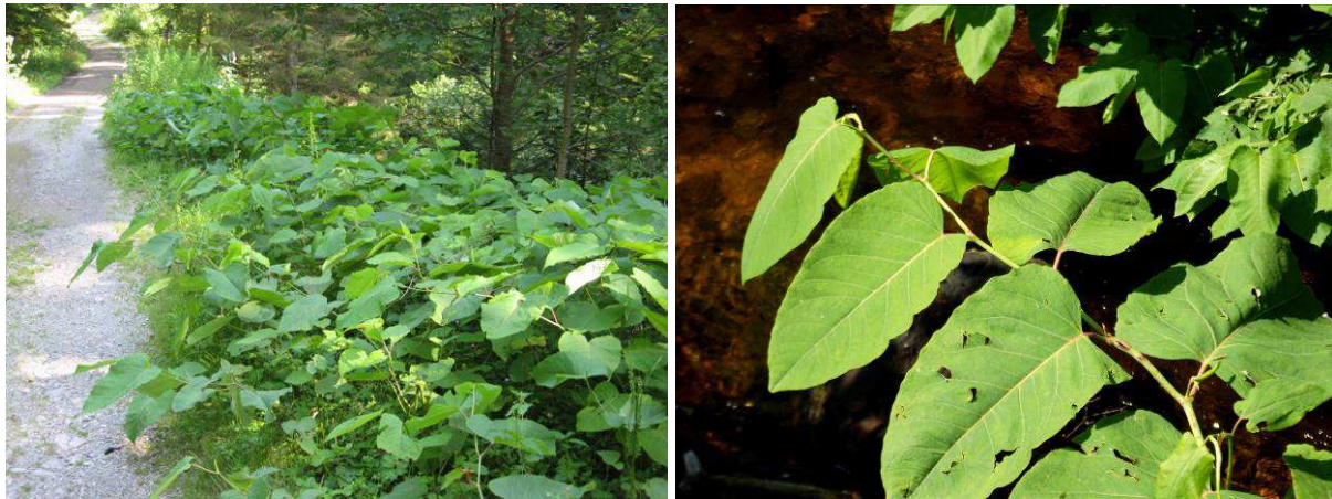
Der Sachalinknöterich bildet noch eindrucksvollere Bestände ... mit seinen bis über 40 cm langen Blättern

Obwohl diese Art keimfähige Samen produziert, verbreitet auch sie sich hauptsächlich über die unterirdisch verlaufenden Rhizome. Die Hinweise zur Verbreitung und Bekämpfung sind fast identisch mit denen für den Japan-Knöterich, deshalb wird diese Art hier nicht in einem eigenen Kapitel aufgeführt.