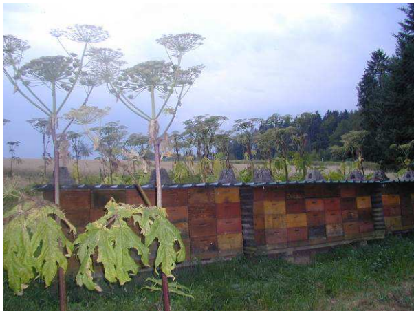
Gezielte Ausbringung eines Imkers zur Bienenweide

Auch Beweidung durch Schafe kann das Wachstum hemmen. Aus der Literatur ist ein Fall bekannt, bei dem eine siebenjährige Beweidung zu einem vollständigen Rückgang geführt hat und auch die Samenvorräte im Boden erschöpft waren, da die Keimlinge ausblieben. An das Landratsamt gemeldete Vorkommen werden wegen der Gesundheitsgefahren übrigens kartiert und laufend bekämpft , teils auch mit Hilfe der Forstverwaltung, der Bauhöfe und der Stadtgärtnereien vor Ort.