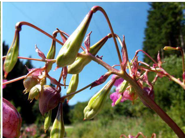
...hier mit den zum Aufspringen bereiten Samenkapseln