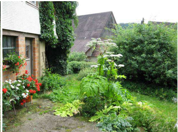
Riesenbärenklau im Vorgarten (hier ca. 1,80 m hoch)