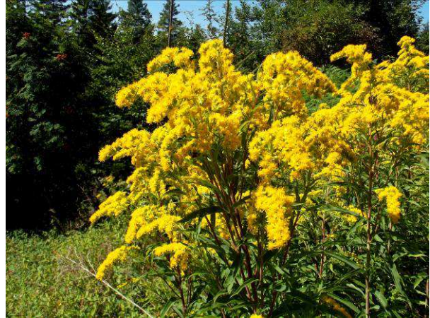
Goldruten in der Blüte werden auch von Insekten besucht